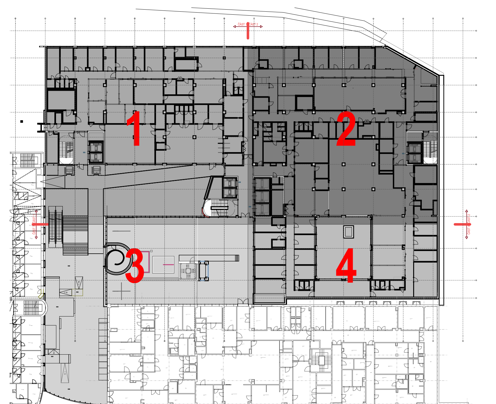
SCHÉMA DĚLENÍ OBJEKTU